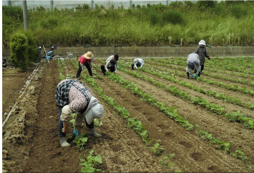
種まきから2か月後 除草・間引き