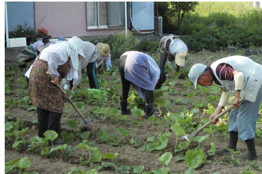
その1週間後 土寄せ