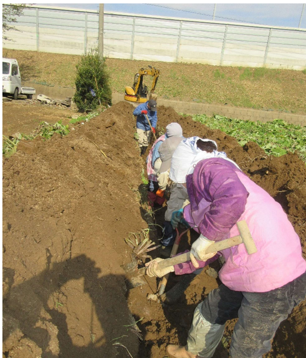
8 か月後 ごぼう掘り・収穫