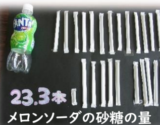
23.3本! メロンソーダの砂糖の量