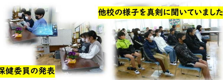
他校の様子を真剣に聞いていました

30秒以上洗うと、手はだいぶきれいになりました。洗う場所を意識して洗わないと、なかなか汚れは落ちませんでした。感染症予防のためにも、これからいねいに洗っていこうと思います!