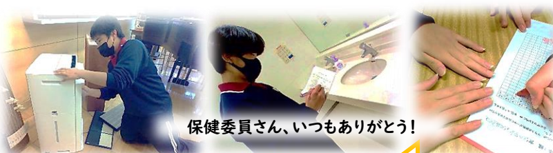
空気清浄機の掃除

1年生の保健委員が中心となり、日頃の活動についてスライドを使って発表をしました。毎日実施する仕事としては健康観察や空気清浄機加湿器の管理があります。定期的には実施する仕事としては、爪検査や衛生点検、石けんの補充などがあります。その他には息スッキリさわやか週間の実施や、宿泊行事での健康管理などがあります。活動発表や感想発表担当の生徒は立派に話すことができました。