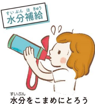
水分をこまめにとろう

5月は熱中症シーズンの始まり。急に暑い日が出てきて、暑さに慣れていない体がついていけず、熱中症になりやすい時期です。暑さに負けない体づくりをはじめましょう!