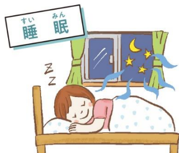
ぐっすり眠れる環境を整えよう