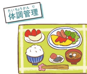
体調を整え丈夫な体を作ろう