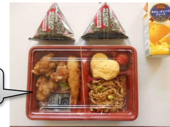
今日のお弁当です