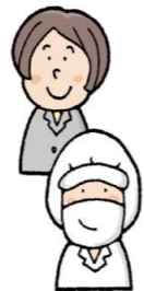
栄養士や調理員さん