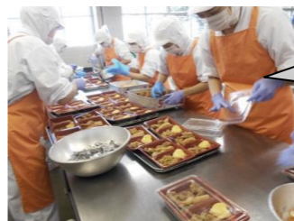
調理員さんが、朝はやくから作っています

10月25日、青空給食が実施されました。異学年交流で、3-5年生、2-4年生、1-6年生が班ごとにお弁当をいただきました。