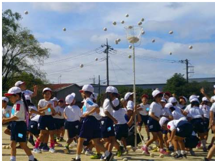
モリモリマッチョ玉入れ（1・2年）

本校では、子供一人一人に「体力の向上と、運動に親しみ健康に生活する力」を育成していくため、明日以降も、体育科の授業改善など、教育活動を一層充実させていきます。