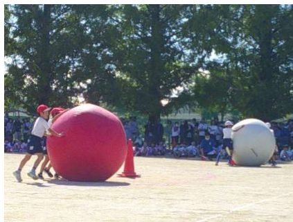
灼熱のカスカベボール（3・4年）