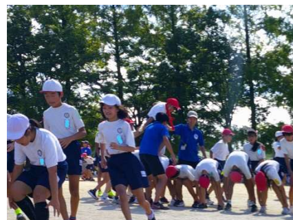
繋げ～心を一つに 栄光の架橋へ～（5・6年）