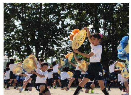
カラフル花笠(3・4年)