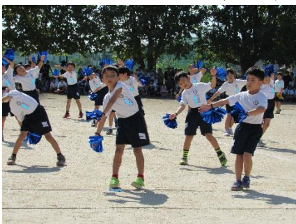
ナイスアイデア!(1・2年)

明日以降も、体育科の授業改善などを一層充実させ、子供一人一人に「体力の向上と、運動に親しみ健康に生活する力」を育成していきます。そして、来年度の運動会では、さらに成長した子供たちの姿をご覧いただきたいと考えています。