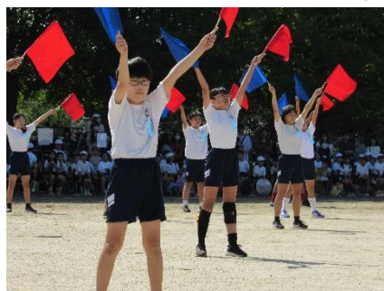
輝き ～全員で輝け、最高の思い出～(5・6年)