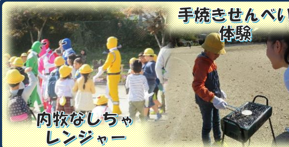
内牧なしちゃレンジャー