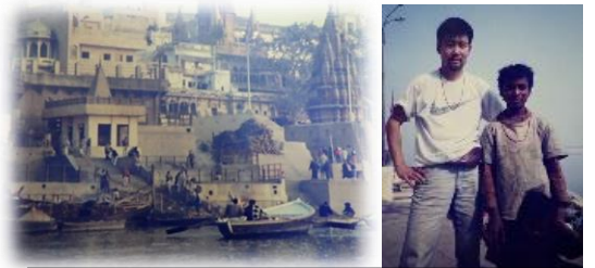
ヴァーラーナシーにて インドの少年と

令和7年（2025年）、365日間の時間をどう使うべきか。効率のみを追い求めるのではなく、とことん試行錯誤を重ねる時間や、ぼーっとしてリラックスする時間なども大切にしていきたいものです。子どもたちの学びも人生も、ある程度の遠回りはむしろ深い学びや真の豊かさをもたらしてくれるのではないのでしょうか。