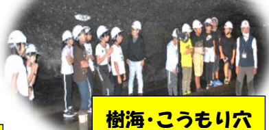
樹海・こうもり穴