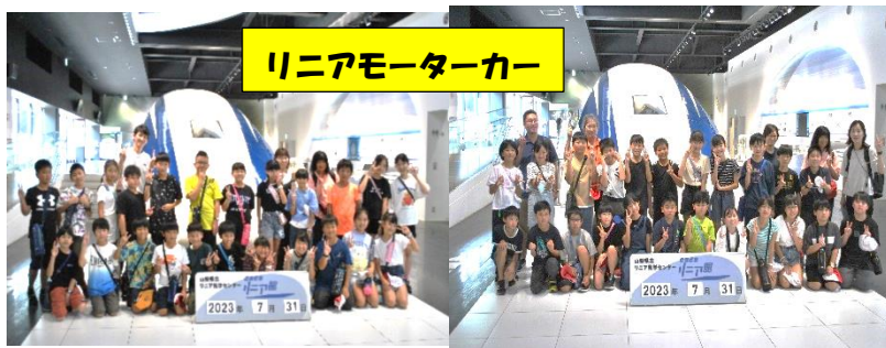
リニアモーターカー