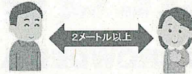
距離を保って、会話をする際はマスクは不要