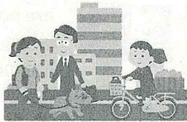
徒歩や自転車での通勤・通学など、人とすれ違う時も不要