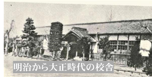
明治から大正時代の校舎