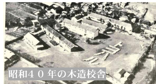
昭和40年の木造校舎