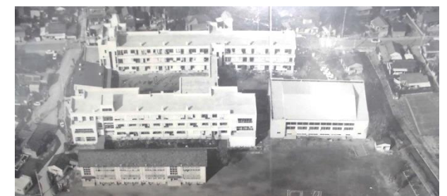
昭和49年の鉄筋校舎と木造校舎