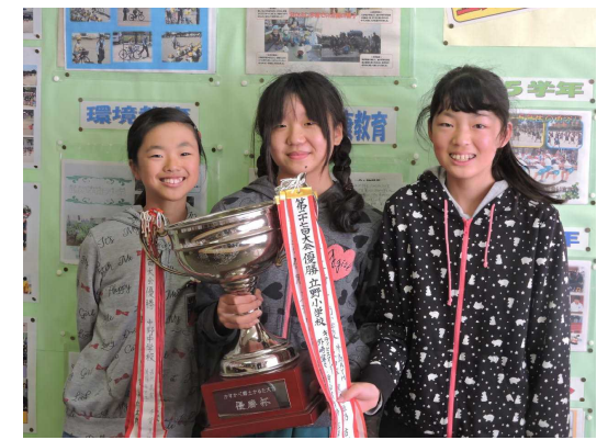
【かすかべ郷土かるた大会】