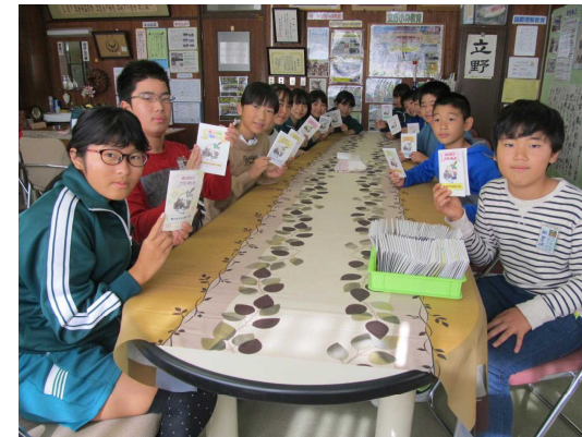
【希望の花を咲かせよう】

かすかべ郷土かるた大会に出場した6年生チームが小学生の部で見事優勝。個人練習・チーム練習を積んで214チームの頂点。立野小初の快挙です。