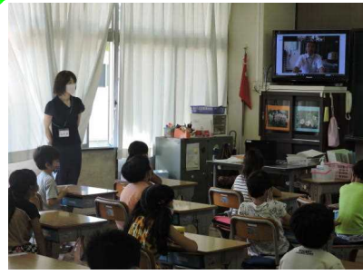
【TVによる始業式→学級指導】