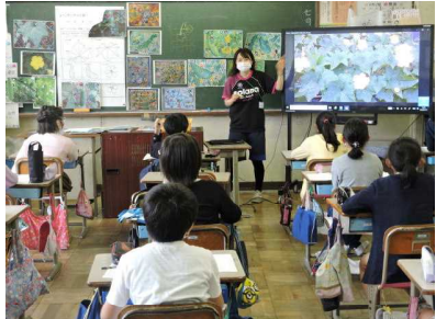
【図画工作・郷土を描く】