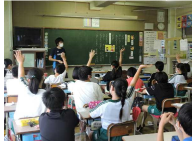
【豊かな心を育てる道徳】