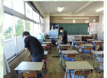
【放課後・職員による清掃、消毒】