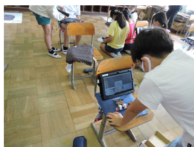
【プログラミング学習】