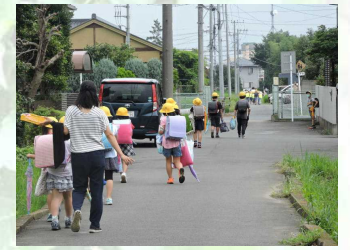
【職員による下校見守り】