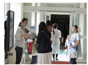
【学級懇談会・職員による消毒】