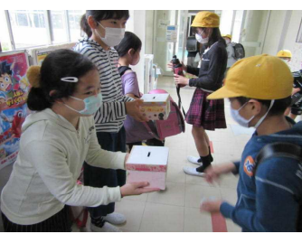
【緑の羽根募金・福祉委員会】