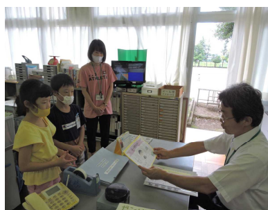
【生活科学学習の成果を校長に報告】