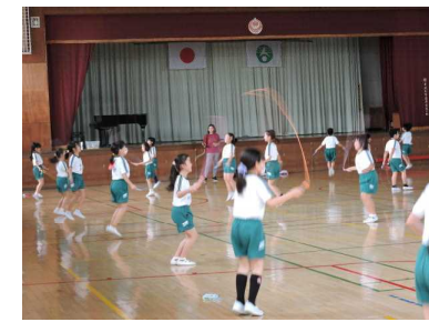
【体育・間隔をとってなわとび】

今後も学校では、健康安全を第一に考え、教職員一丸となって、新型コロナウイルス感染症と熱中症防止の様々な対応に努めながら、知・徳・体のバランスのとれた力を育ててまいります。 引き続き保護・地域の皆様のご理解とご協力をよろしくお願いいたします。