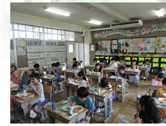
【担任外の職員も給食指導】