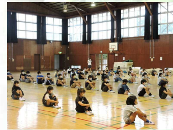
【間隔を取っての学年集会】