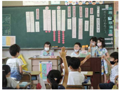
【学級活動・新しい学校生活様式】