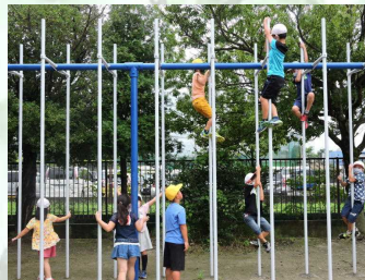
【業間時間・元気に遊ぶ子どもたち】