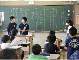
【今年度初の代表委員会】