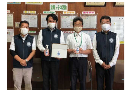
【ライオンズクラブ消毒寄贈】