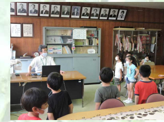
【校長へのインタビュー】