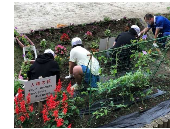
【朝の活動・栽培委員会】