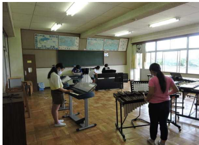
【3つの部屋に分かれて音楽学習】