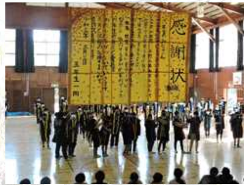
＜昨年度の卒業おめでとう集会の様子＞

そこで、昨年度は様々な学校行事や学習活動が中止になりましたが、本年度は、文科科学省や埼玉県、春日部市教育委員会の指導の下、できる限り教育活動を進めていきたいと考えています。実施に当たり、子供たちの健康安全を第一に考えた感染対策を行いますので、保護者の皆様には、御理解と御協力、御支援を賜りますようお願い申し上げます。