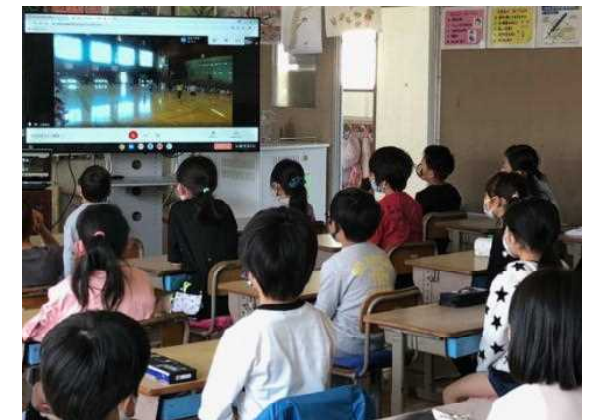
＜教室からお祝いの気持ちを贈りました＞