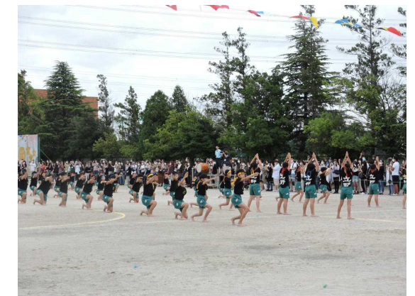
【6年生 一致団結 本気の組体操2020】