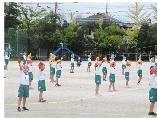
【1年生 どんなことにも挑戦しようやってみよう2020!】

9月19日(土)、第44回秋季運動会を開催しました。新型コロナウイルス感染症拡大防止、熱中症防止の観点から、開催方法を大幅に変更しての実施でしたが、立野っ子たちは、最後まで元気よく、一生懸命に演技をすることができました。新しい生活様式の中で、大きな行事をやり遂げ、また一つ、心も体もたくましく成長しました。保護者、地域の皆様、御理解・御協力ありがとうございました。