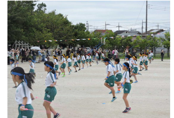
【4年生 リズムなわとび2020 ~心一つに~】