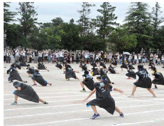
【5年生 立野ソーラン 2◎2◎】