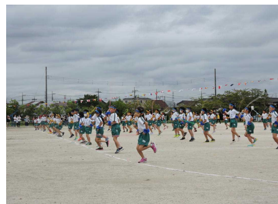
【3年生 みんなでいっしょに楽しもう! 104人のなわとびダンス2020】