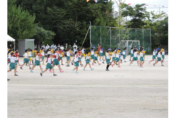
【2年生 レッツ HELLO ダンス! ~80人の輝き~】