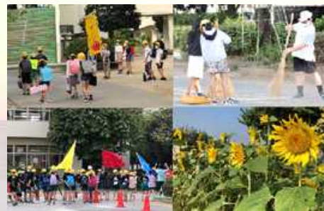
6年生「愛校活動」の様子

さて、学校は令和2年度の3学期始業式を迎え、1年間のまとめの時期となります。各教科の教科書は、いつの間にか残りのページが少なくなり、学習内容が以前より難しくなっています。各学年が4月から一つずつ進級する準備の時期でもあるのです。しっかり学習活動に取り組んで、今年度の悔いが残らないように3学期を締めくくってほしいと思います。特に6年生は小学校卒業という大きな節目を迎えることとなります。小学校の学習活動の総まとめとして残りの小学校生活に取り組んでほしいと思います。ところで、6年生は立野小学校6年間の集大成として1学期から愛校活動実行委員会を中心に全員が様々な活動に取り組んできました。「あいさつ