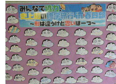
95人の修学旅行への思い