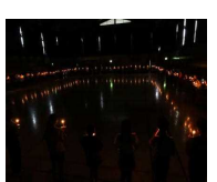
キャンドルリレー