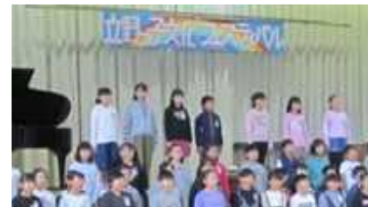
昨年の文化フェスティバル

例年この時期には文化的な学校行事がたくさんあり、特に「文化フェスティバル」は、地域や保護者の皆様に立野小学校の子どもたちの元気いっぱいな発表をご覧ください機会として、重要な役割を担ってきました。子どもたちにとっても互いに力を合わせ、協力して作り上げる大切な活動のひとつです。残念ながら本年度は実施することが困難な状況となり、とても寂しく思っています。立野小学校の子どもたち全員が顔を合わせ、大きな声で校歌が歌える日がくることを心から願っています。