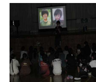
担任からメッセージ