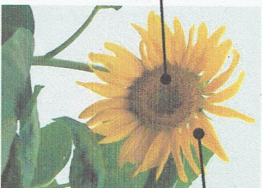
内がわにある、一つのような形をした小さな花