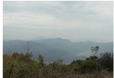
長門市 花尾山頂からの風景