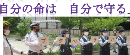
自転車点検の合言葉 「ブ・タ・ベル・サ・ハラ」

5月25日(木)に、1年生と3年生へ向けて、交通安全教室を実施しました。今回の学習を生かし、自転車の事故や飛び出しの事故など、交通事故に十分気をつけてすごしていきましょう。ぜひ、御家庭でも、交通安全についてお話しする機会をつくってください。