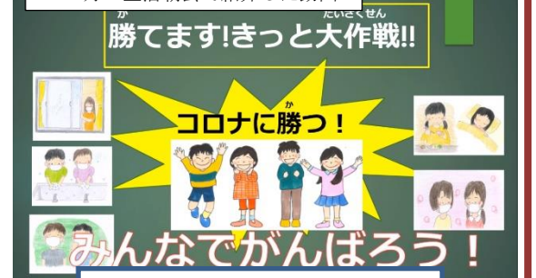
この動画はホームページで紹介しています。是非ご覧ください