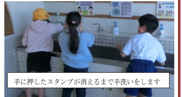
手に押したスタンプが消えるまで手洗いをします