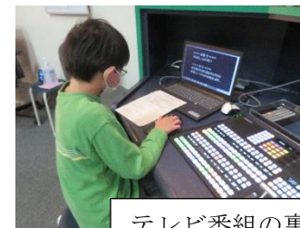
テレビ番組の裏側を知りました。

SKIPシティ・中島紺屋に校外学習に行きました。映像作成の裏側を学んだり、藍染を体験したりすることができました。