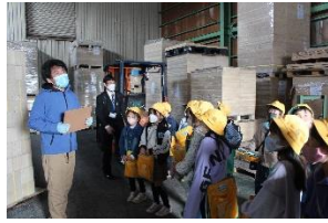
倉庫の中には、たくさんのお桐の木がありました。

3年生が松田桐箱さんと春日部消防署へ校外学習に行きました。春日部市で、なぜ桐箱が作られるようになり、有名になったのか、消防署では、訓練の様子や消防車の説明をお聞きすることができました。