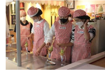
美味しくできますように!!