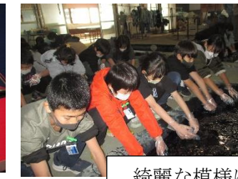
綺麗な模様に仕上がりました。