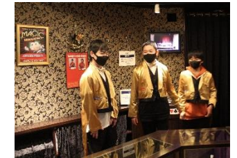
マジシャンが、先生たちの前で、コインを消すマジックを披露!!