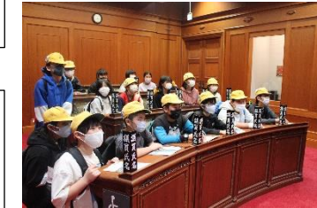
憲政記念館では、議員席に座って、議場体験。「異議なし!!」