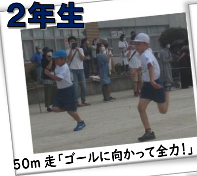
50m 走「ゴールに向かって全力！」