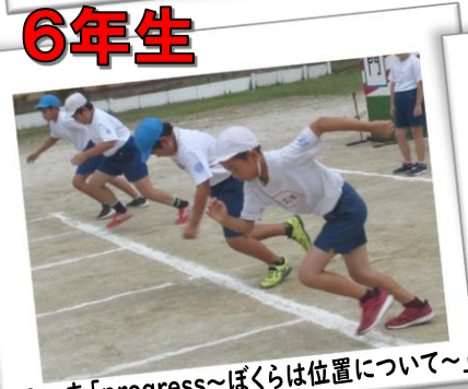
70m 走「progress～ぼくらは位置について～」