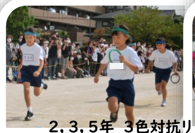
2, 3, 5年 3色対抗リレー