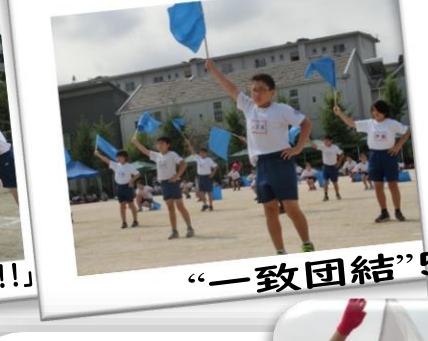
“一致団結”5レンジャー