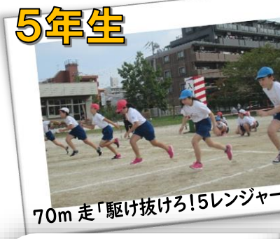
70m 走「駆け抜けろ!5レンジャー!!」