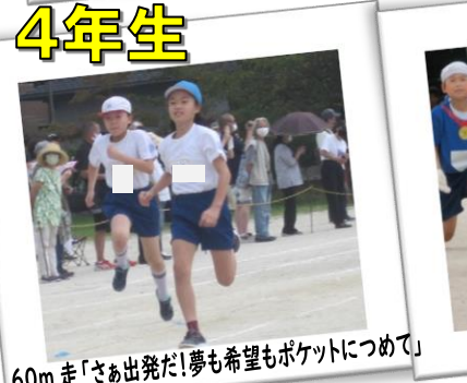
60m 走「さあ出発だ!夢も希望もポケットにつめて」