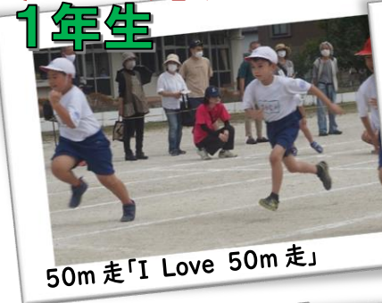
50m 走「I Love 50m 走」