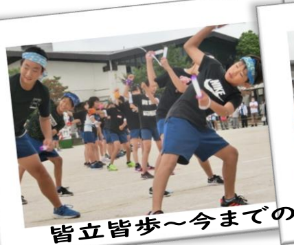
皆立皆歩～今までの軌跡とともに～