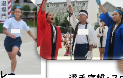
選手宣誓・スローガン発表・準備運動