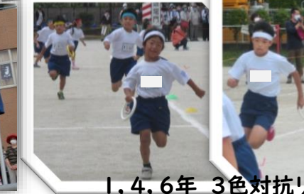
1, 4, 6年 3色対抗リレー