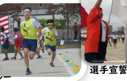
選手宣誓・スローガン発表・準備運動