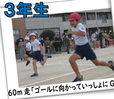
60m 走「ゴールに向かっていっしょにGO」