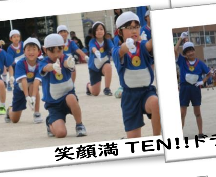
笑顔満 TEN!!ドラえもん