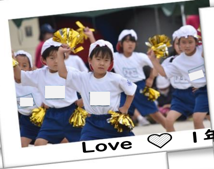
Love ♡ 1年