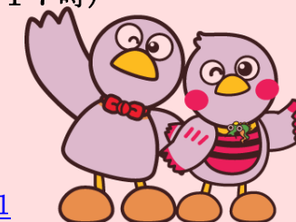
埼玉県のマスコット「コバトン」&「さいたまっち」