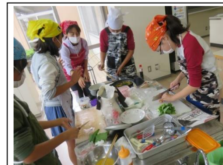
6年 家庭科調理実習 10/18 グループの友達と協力して、朝食の献立を考えて調理しました。