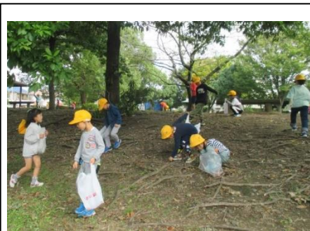
1年 校外学習 10/16 公園で秋探しをしながら、友達と仲良く活動しました。