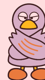
埼玉県のマスコット「コバトン」