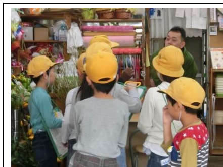
3年 商店街見学 10/16 商店街を見学し、仕事の様子や様々な工夫を見つけ