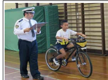
4年 自転車免許講習 10/1 体育館で自転車免許講習を行いました。