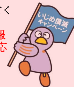
埼玉県のマスコット「コバトン」

本校では、毎月定例で会議・情報交換の場を設け、気になる事柄や情報など教職員で共通理解しながら、いじめの未然防止、早期発見、早期対応に努めております。