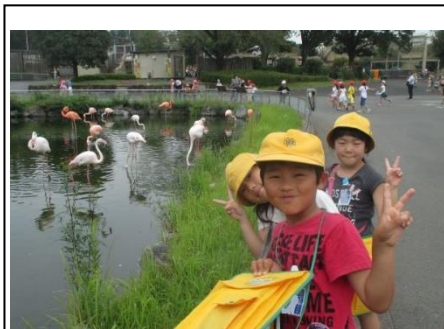
2年 校外学習 10/3 グループで活動しているいろいろな動物を見学しました。