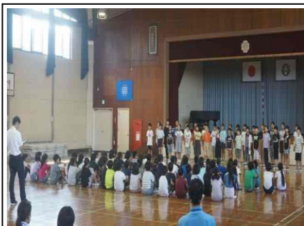
5年 市内音楽会オーディション 9/26 市内音楽会に向けて、学年でオーディションを行いました。