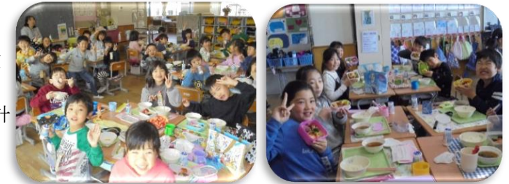
昨年度、お弁当の日の様子