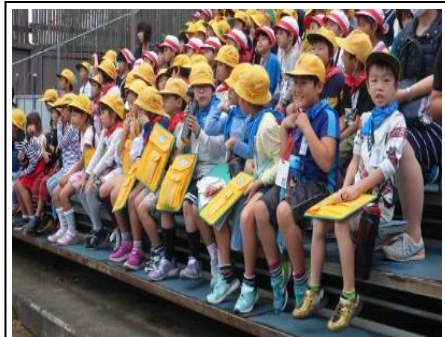
2年 校外学習 10/11 グループで活動しているいろいろな動物を見学しました。