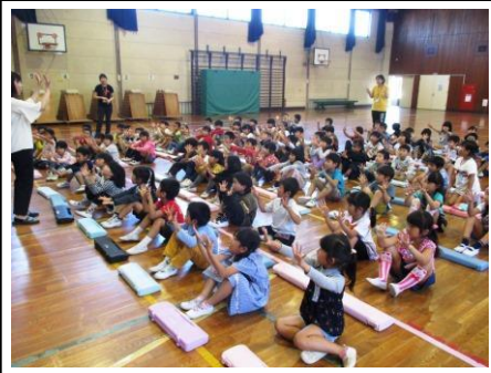
1年 鍵盤ハーモニカ講習 9/28 指導者の先生から上手な演奏方法を学びました。