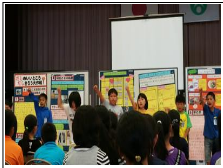
5年 家庭科研究発表 9/20、10/5 家庭科の学習を生かして、発表会に参加しました。