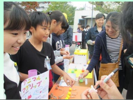
6年 「ドリームカンパニー」 総合的な学習の時間で学んだことを生かし、商品販売をしました。

武西ふれあい祭では、バザーやゲームコーナー、模擬店など各ブースで、保護者、子供たち、教職員が協力して楽しい時間を過ごすことができました。御協力ありがとうございました。