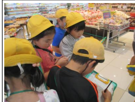
3年 スーパー見学 10/1、2、10 スーパーマーケットを見学し、様々な工夫を発見しました。