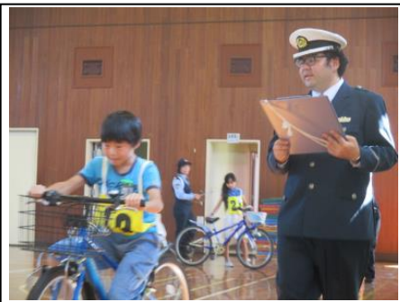
4年 自転車免許講習 10/2 体育館で自転車免許講習を行いました。