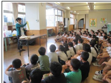
6年 ブックトーク 10/10 市の図書館担当の方をお招きして、本の楽しさを味わいました。