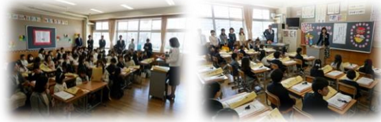
(式後の学級での様子)

春の暖かい空気に包まれる中、4月9日(火)に、入学式が行われました。元気いっぱい1年生86名が、武西っ子の仲間入りをしました。緊張の中、6年生の校歌の紹介やお話をしっかり聞くことができました。