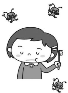
歯みがきしない子