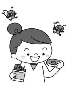
甘いものばかり食べる子