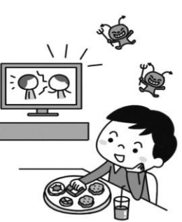
だらだら食いを する子