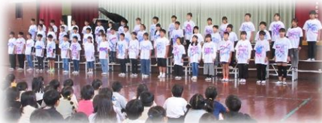
↑ 音楽会での6年生の合唱。下級生が感動して、あこがれる存在。

5年生以下、下級生たちも、そんな立派な6年生の姿を見て、6年生と過ごす最後の時間を大切にしようとしています。その気持ちは「6年生を送る会」に向けて取り組む姿勢や真剣なまなざしにあらわれています。こうして正善小の伝統のタスキは下級生たちに受け継がれていきます。