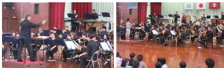
オーケストラを招いての芸術鑑賞会。迫力の演奏を鑑賞しました。また代表児童3名が指揮者体験を行いました。

7月になります。今学期も、残すところあと1ヵ月を切っています。一学期も多くの行事がありましたが、ここまで予定通り順調に進んできています。6月6日には市内陸上大会、17日には放課後子ども教室、19日には芸術鑑賞会(オーケストラ鑑賞)、等々、それぞれの行事で保護者・地域の皆様のご協力をいただき、子供たちの輝く笑顔がたくさん見ることができました。