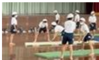
子供同士が技について教え合い、学び合う学習を取り入れた体育の授業(6年生のマット運動)

本校の学校教育目標の一つは『自ら考え本気で学ぶ子』です。「主体的・対話的で深い学び」の実現は、「本気で学ぶ」児童の育成につながります。学校は、子供たちの『わかった!』『できた!』の声が響き合い、『よかった』『楽しい、うれしい!』と笑顔があふれるような、学習スタイルの構築・定着を目指し、教職員同士が学び合い、高め合い、よりよい授業を実践するべく、日々の教育活動に取り組んでいます。