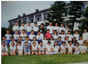
〈平成元年度6年2組の集合写真〉

昭和50年4月、南桜井小の「桜」と川辺小の「川」をとり桜川小学校として開校し、7410名の卒業生が巣立っていきました。卒業アルバムや現存する記念品等の写真をもとに桜川小学校の歴史を振り返ってきたいと思います。