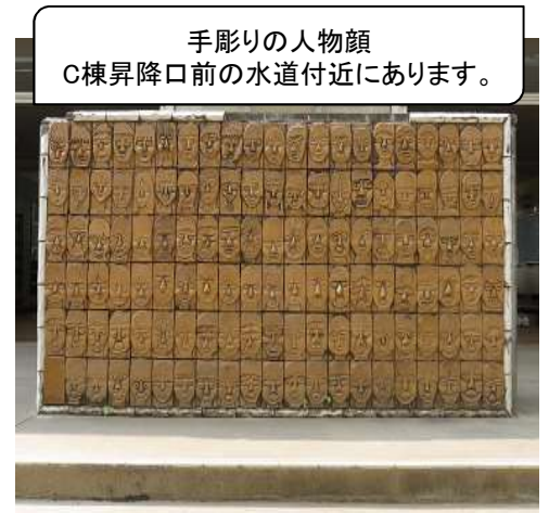
手彫りの人物顔 C棟昇降口前の水道付近にあります。