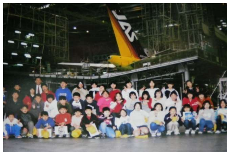
〈平成14年度5年生社会科見学〉