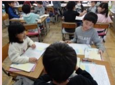
交流を楽しむ・話をよく聞く