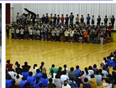
1/23(木) 音楽集会(4年発表) 4年生が、練習の成果を生かして、合唱や合奏を披露しました。