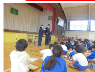
1/21(火) 3年・社会科学習 3年生の社会科で春日部警察の警察官の方に来校いただきました。仕事のお話などをうかがいました。