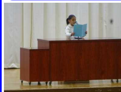
1/8(水) 始業式 新しい学期の始まりです。2年生が代表して目標を発表しました。