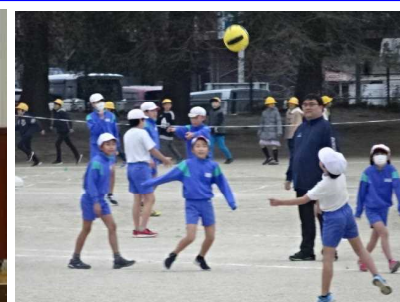
1/22(水) クラブ(3年見学) 4～6年生のクラブ活動を来年から参加する3年生が見学しました。