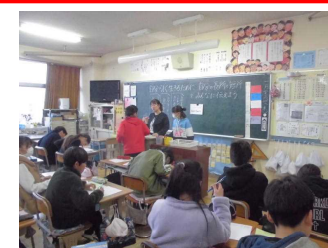
1/23(木) 他校の先生の来校 近隣の庄和高校・葛飾中・こばと幼稚園・庄和幼稚園の先生方が本校の授業を参観しました。