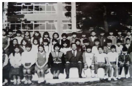
〈昭和54年度6年5組の集合写真〉