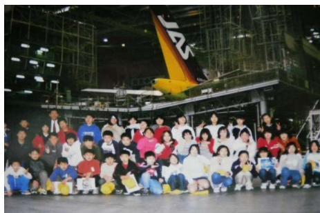
〈平成14年度5年生社会科見学〉