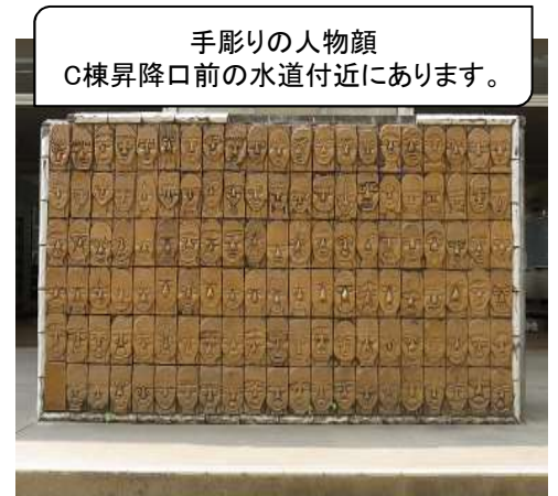
手彫りの人物顔 C棟昇降口前の水道付近にあります。