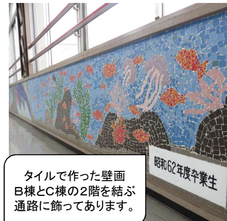
タイルで作った壁画 B棟とC棟の2階を結ぶ 通路に飾ってあります。