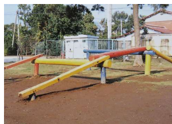
〈昔は、こんな遊具もありました〉