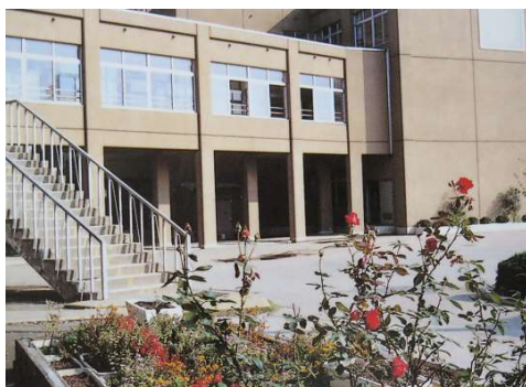
〈↑ 昭和60年代の校舎 ↓〉