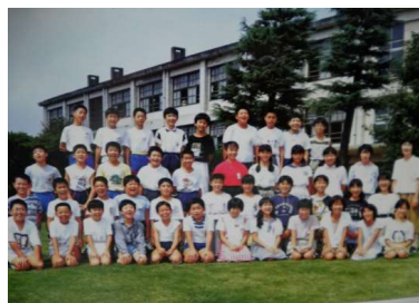
〈平成元年度6年2組の集合写真〉

昭和50年4月、南桜井小の「桜」と川辺小の「川」をとり桜川小学校として開校し、7536名の卒業生が巣立っていきました。卒業アルバムや現存する記念品等の写真をもとに桜川小学校の歴史を振り返ってきたいと思います。