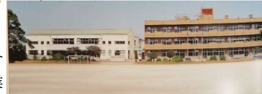
〈新A棟校舎完成 平成4年 ↑〉

保護者、地域の方々、教職員が築き上げてきた輝かしい歴史の上に今の桜川小があります。その伝統を大切にしながら、そして新たな良さを加えながら、目指す学校像「地域と共に はぐくむ やさしさと 笑顔あふれる活力ある学校」となるよう努めてまいります。