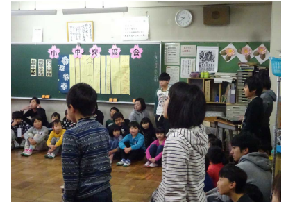
12/13(金) なかよし交流会 葛飾中で南桜井小と一緒に、なかよし学級の小中交流会を開催。