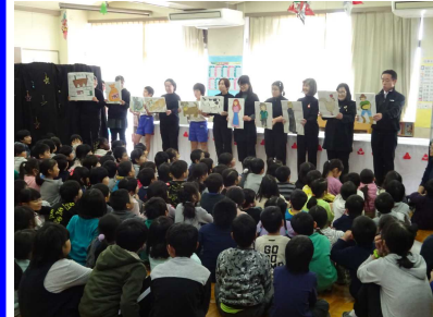
12/6(金) 読み聞かせクリスマス会 読み聞かせボランティアさんの紙芝居や歌。校長先生も出演。