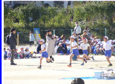
11/29(金) マラソン大会 どの児童も目標達成に向け、周囲の声援を受け懸命に走りました。