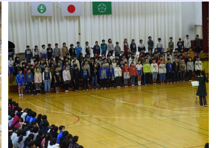
12/19(木) 音楽集会 5年生が、高学年として立派な合唱や合奏を披露しました。