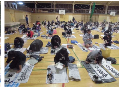
12/5(木) 書きぞめ競書会 集中した空気の中で、一人一人が真剣に用紙に向かいました。