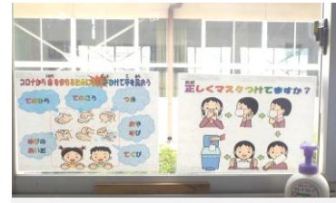
手洗い30秒とマスクをし っかりする