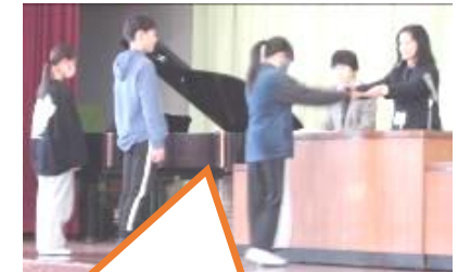
終業式に表彰を行いました。どの子も立派な返事と態度で田矢校長先生から賞状を受け取りました。