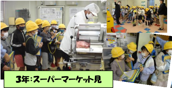
3年:スーパーマーケット見