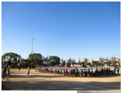
きれいな秋晴れのもと と行われました。 全校:持久走大会