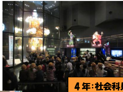
4年:社会科見学(川越・紙すき)