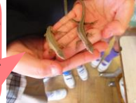
委員会活動や休み時間のコマ...です