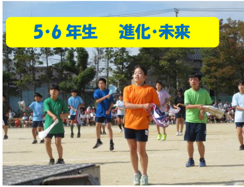
5・6年生 進化・未来

走る! 跳ぶ! 踊る!! 子供たちの頑張りに、多くの方々から温かいご声援をいただきました。ありがとうございます。これからも、子どもたちの笑顔あふれる活動を教職員一丸となり支援していきます。今後ともよろしくお願いいたします。