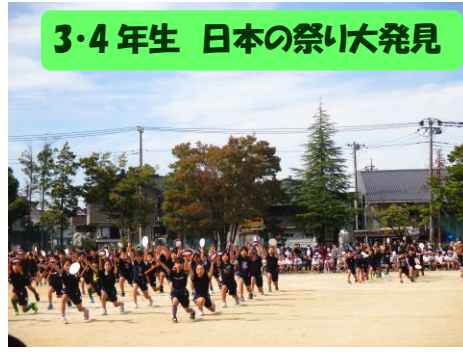
3・4年生 日本の祭り大発見