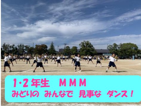
1・2年生 M M M みどりの みんなで 見事な ダンス!