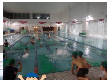
水泳学習が 始まりました