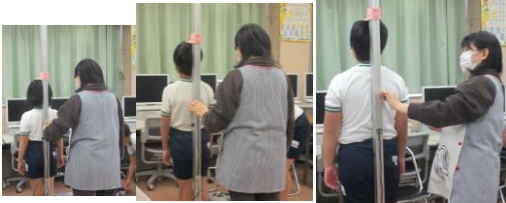
低学年 中学年 先生より大きい高学年