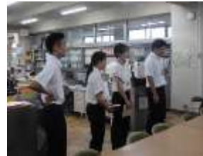
9/11 (月) ~ 教育実習開始 4名の学生が教育実習及び学校体験のため来ました。一生懸命学んでいます。