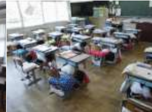
9/1 (金) シェイクアウト訓練 関東大震災発生から100年、命を守る教育は今後も継続します。