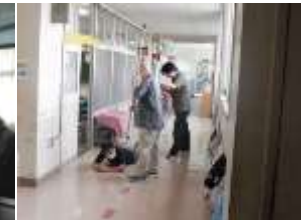
9/20 (水) 不審者想定避難訓練 児童は教室にバリアードを作り、安全を確保したのち、避難しました。