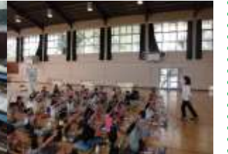
9/7 (木) 1年生 鍵盤ハーモニカ講習会 外部指導者をお招きし、音を使った物まねをしました。