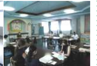
9/15 (金) 学校保健員会 学校歯科医の先生が、保護者、教員を対象に歯磨きの大切さについて、お話くださいました。