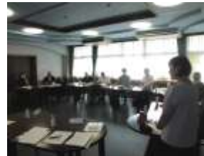
9/20 (水) 学校運営協議会 学区内の交通安全、敷地内の小動物、環境整備等について協議しました。