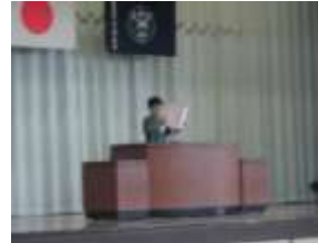
8/29 (火) 第2学期 始業式 転入生4名、9月1日に1名を迎え、小湊っ子は295名になりました。

※小湊小ホームページ内「小湊小ブログ」に子供たちの活動を中心に、学校の様子をアップしています。動画の配信にも挑戦中です。