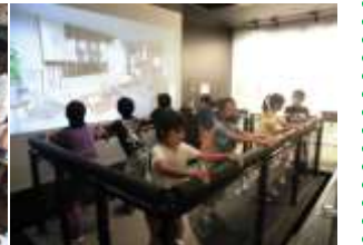
9/22 (金) 4年生 社会科見学 埼玉県防災教育センター・首都圏外郭放水路で、五感を使って学習しました。