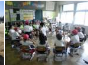
9/14 (木) なかよし集会 フルーツバスケットや取りゲームなど、縦割り班で工夫して遊びました。