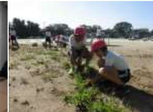
9/13 (水) 愛校活動・親子除草 保護者や地域の方にもご参加いただきました。ありがとうございます。次回10/4 (水) です。