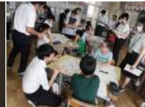
9/21 (木) 校内授業研究会 3年2組で実施しました。子供たちの豊かな学びのために教師も学び続けます。