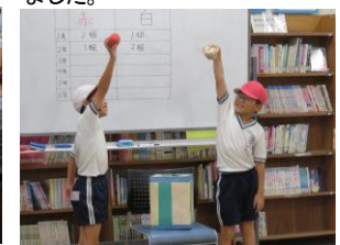
19日(金)さわやかタイム 今年の運動会の紅白抽選会を行いました。