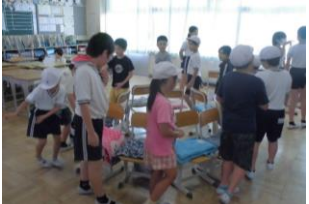
11日(木)なかよし集会 縦割りグループで室内遊びをしました。