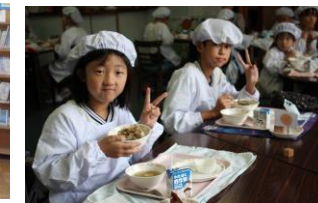
4日(木)8月生まれお誕生日ランチ 特別なランチでお祝いしました。