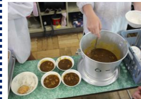
5日(金)若獅子カレー 埼玉西武ライオンズの選手も食べているメニューを味わいました。