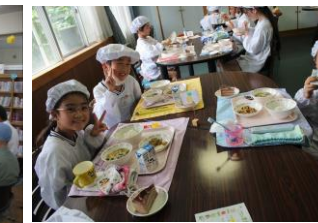
18日(木)9月生まれお誕生日ランチ 9月生まれのお友達と特別なランチでお祝いしました。