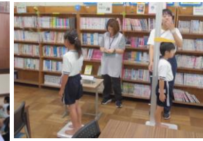
9月1日(月)2日(火)発育測定 夏休みの間の成長が実感できました。