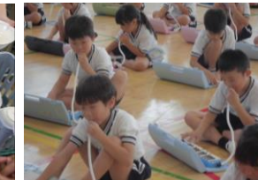
8日(月)1年生鍵盤ハーモニカ講習会 音の上手な出し方を教わりました。