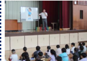
8月29日(金)第2学期始業式 新学期のスタートです。決意を新たにしました。

※ホームページの「小淵小ブログ」を更新しています。ここに載っていない学校の様子もアップしていますので、ぜひご覧ください。