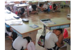
5日(金)シェイクアウト訓練 関東大震災が発生した日時に合わせて実施しました。