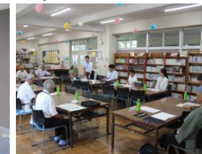
17日(水)学校運営協議会 第3回は9月までの教育活動と学力調査結果の報告でした。