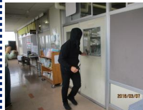
12日(金)不審者対応避難訓練 不審者が校内に侵入したことを想定して実施しました。