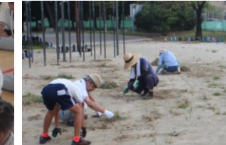
10日(水)愛校活動 ボランティアの方にも手伝っていただき除草活動をしました。