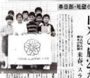
「校旗が南極へ」 当時の新聞記事