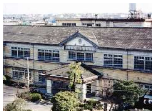
昭和13年 木造校舎が完成