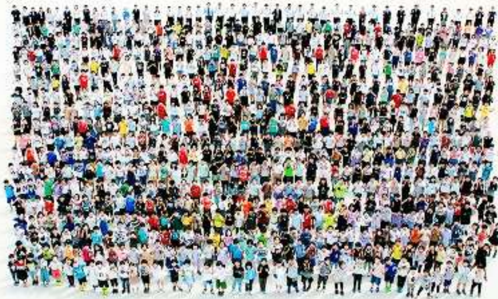
祝150周年記念 春日部市立粕壁小学校 全校児童集合写真 (2021年撮影)