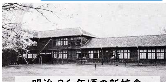
明治36年頃の新校舎

・開校当時の児童数は149人 (男子115人、女子34人) ・明治39年には、 849人となりました。