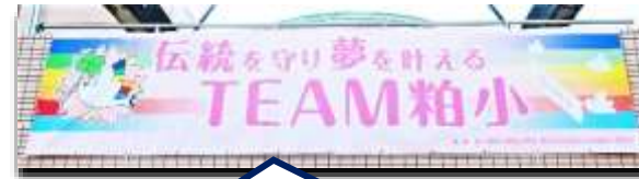
150周年記念の横断幕