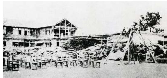
大正12年 大震災で校舎倒壊