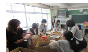
図書ボランティア