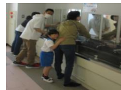
清掃ボランティア

備後小学校PTAでは、「できる人ができることをやれるPTA」をスローガンに、PTA役員さん、会員である保護者の皆さんの負担をなるべく減らしながら、PTA活動の活性化を考えてくれています。現在、清掃、図書、花の3つの分野で、ボランティアの有志を募り、学校の環境整備を行ってくださっています。活動ごとにスクリレでご連絡いたします。興味・関心のある方はご参加ください。