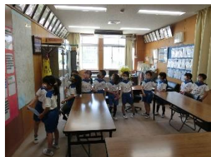
何があるかな? じ〜と見つめる子供たち。

さて、4月のある日、1年生が担任に連れられて校長室にやってきました。学校の様子やきまりを知る生活科の学習の一つです。探検の仕方を担任から教わり静かに校長室を見学していた1年生ですが、「よく見て行ってね。」の言葉で、きょろきょろおどしました。何一つ見逃さないぞ、という気持ちがむくむくと沸き上がってきたのでしょう。「あ、職員室とつながってるんだあ。」と職員室をのぞき込み、「結構、先生たちがいる。」とつぶやいた子がいました。教室配置図を使って教えれば、校長室の隣に職員室があることは理解させられるでしょう。しかし、今まさに「つながっている」ということを実感を伴って学ぶことができた瞬間です。また、「結構」というつぶやきからは、これまでの経験、つまり幼稚園や保育所の先生方の人数と比較をしていることがわかります。何気ない学習の一コマですが、そこには、たくさんの学びが存在しています。毎日登校し、友達や先生と過ごす中で、「学び」の場面がたくさんあるのです。友達の考えや意見を聞くことで、自分の考えを再度捉え直したり、教師の助言でさらに深い考えに到達したり…。学校での学びは、そういったことの繰り返しです。もちろん、学力の定着・向上には、家庭学習も大切です。保護者の皆様には、家庭学習の見届け等、これまで同様のご協力をお願い致します。