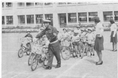
昭和51年交通安全教室