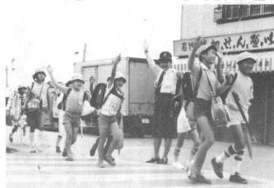
昭和58年頃の登校風景