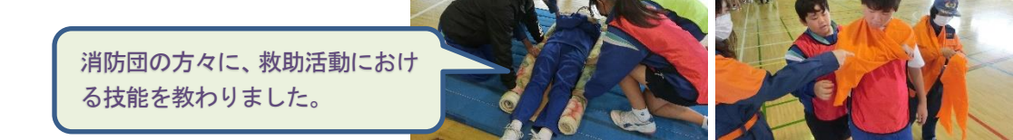
8年生「地域との活動」