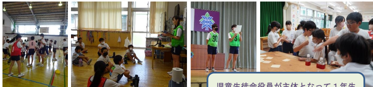
江戸川フェスティバル～Smile Together 楽しめ！江戸フェス～